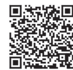
甲南大学学生部 ホームページ

甲南大学では下記の入試制度において、合格者を対象とする奨学金、授業料免除制度を設けています（詳細は入学試験要項を確認してください）。その他の奨学金制度については入学後に説明会などでお知らせします。なお、2018年度在学学生を対象とした制度については、甲南大学学生部のホームページ ( http://www.konan-u.ac.jp/sas/scholarship ) でご確認いただけます。